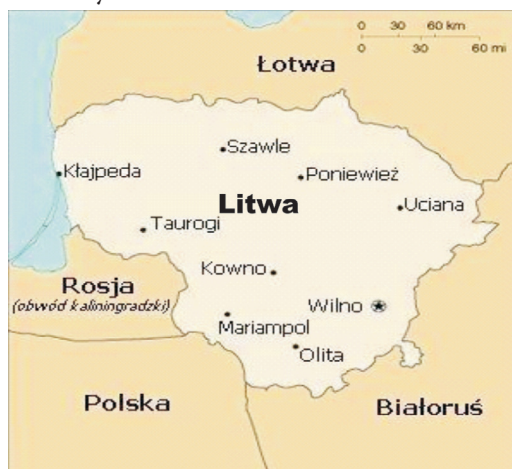
Rysunek 2. Litwa i kraje sąsiednie

Powierzchnia kraju wynosi 65,2 tys. km 2 . Większe miasta to Wilno (stolica), Kowno, Kłajpeda, Szawle oraz Poniewież. Administracyjnie kraj podzielony jest na 10 powiatów (obwodów): kłajpedzki, kowieński, mariampolski, olicki, poniewieński, szawelski, tauroski, teleszycki, uciański oraz wileński. Podział administracyjny terytorium Litwy przedstawia rysunek 4 1 .