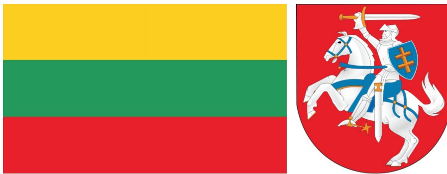
Rysunek 1. Flaga narodowa i godło Republiki Litewskiej